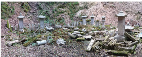
倒木撤去後 平成30年