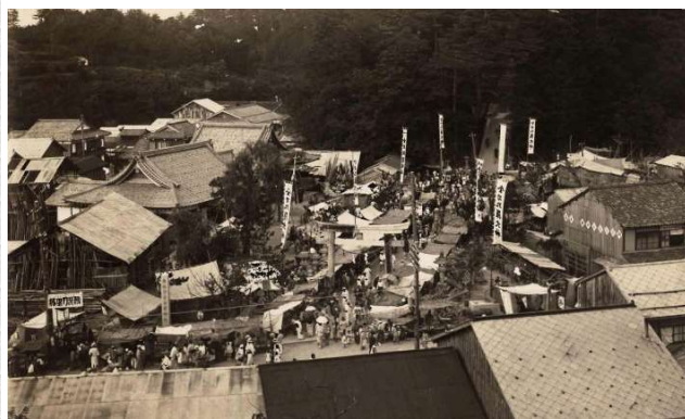
震災復興直後に行われた春祭り

災禍の種類は違いますが、昭和二年の北丹後大地震を乗り越えた象徴的な写真があります。左の大屋根の社務所齋館は震災の三年後に竣工しており、昭和七年に建てられた大鳥居横の灯籠が見えないので、昭和五・六年の春祭りの様子です。町内壊滅の被害からわずか数年。周囲の家々も再建され立派に再興した町で盛大なお祭りが行われています。丹後人の底力が示されている風景です。