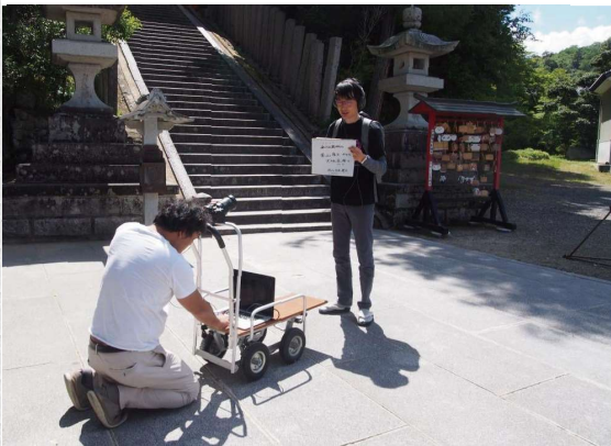
まち歩きガイドのオンライン開催をテスト

疫病蔓延が心配される中、新しい取り組みも始まっています。九月に開催予定のこまねこまつりもどのように開催できるか様々な方策を模索しているところですが、その中で街歩きガイドをオンラインで開催できないだろうか。とテスト開催を行いました。境内をガイド案内する様子をインターネットで中継配信し、参加者は自宅のパソコンのオンライン会議システムで体験できる。というもので、時勢に合わせた取り組みに期待が高まります。